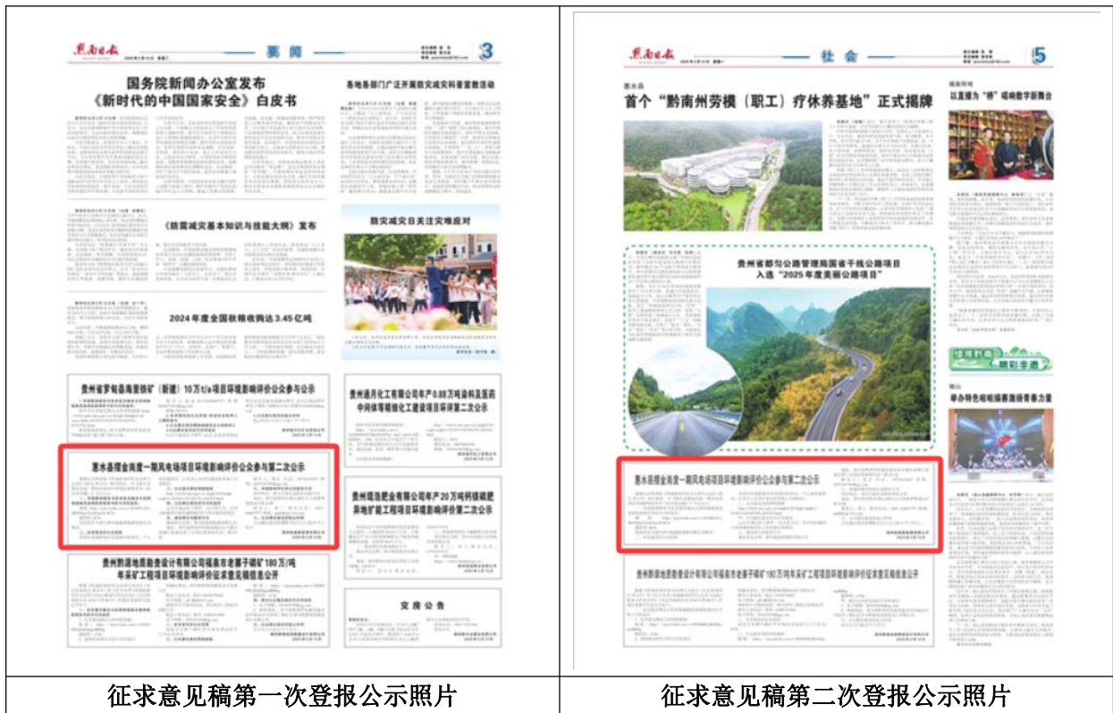
征求意见稿第一次登报公示照片