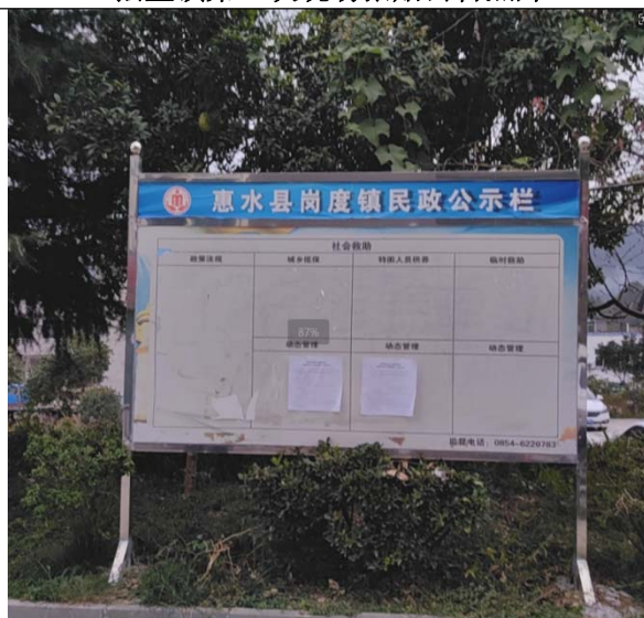
岗度镇第一次现场张贴公告照片