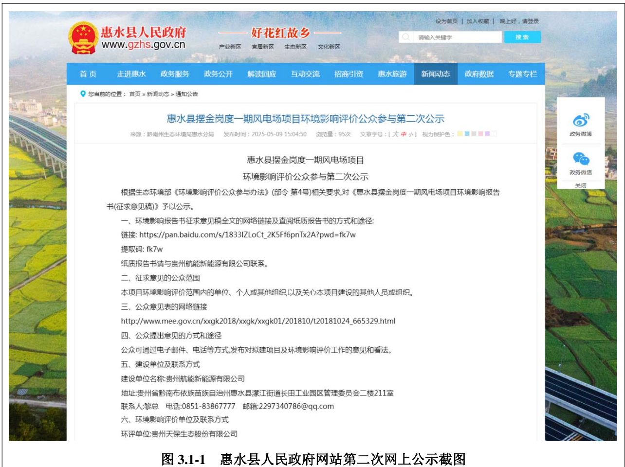
图 3.1-1 惠水县人民政府网站第二次网上公示截图