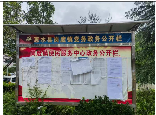
岗度镇第二次现场张贴公示照片