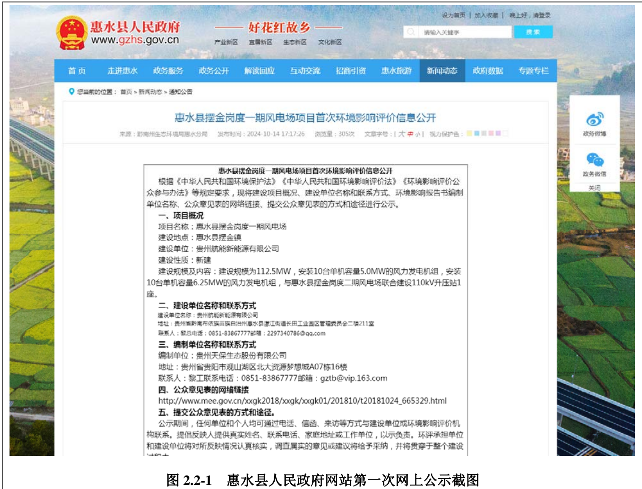
图 2.2-1 惠水县人民政府网站第一次网上公示截图

https://www.gzhs.gov.cn/xwdt/tzgg/202410/t20241014_85938346.html