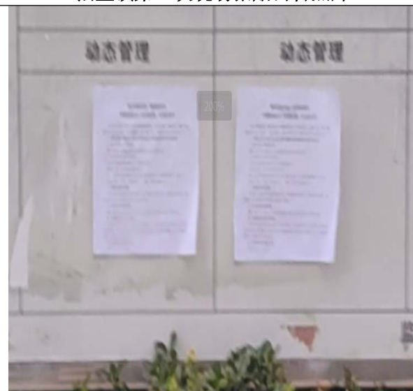
岗度镇第一次现场张贴公告照片

载体选取符合性分析： 本项目首次公示方式采用在建设项目所在地乡镇政府的政务公开栏张贴公告，载体选取符合《环境影响评价公众参与办法》第十一条“通过在建设项目所在地公众易于知悉的场所张贴公告的方式公开”的要求。