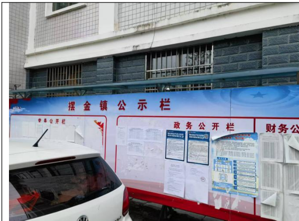
摆金镇第二次现场张贴公示照片