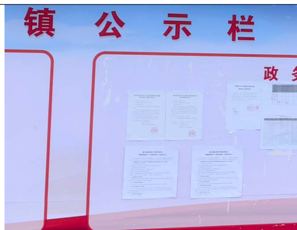
摆金镇第一次现场张贴公告照片