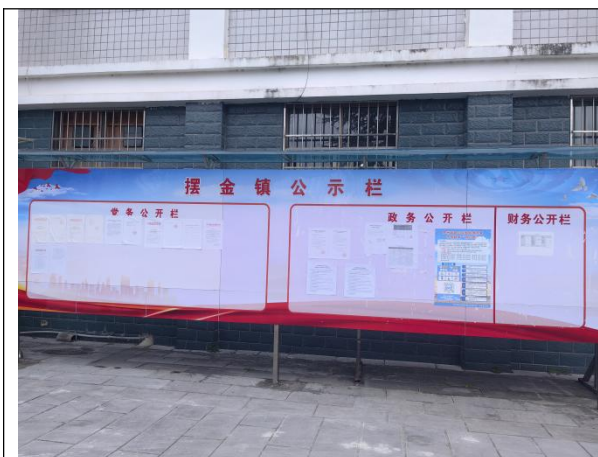
摆金镇第一次现场张贴公告照片